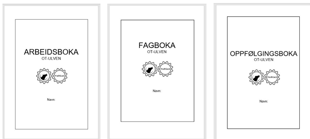
Forsiden på de tre bøkene elevene bruker.

Oppfølgingsboken er elevens verktøy for å holde oversikt over sin sosiale læring. Her setter eleven seg konkrete sosiale mål sammen med miljøterapeut, og sammen lager de en plan for hvordan de sosiale målene skal oppnås. Et eksempel på et sosialt mål er troverdighet, der eleven må jobbe med å gjøre det han eller hun sier.